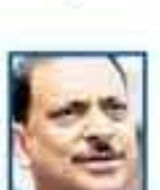
ईशान्य भारतातील रस्तेविकासकडे सरकारचे लक्ष आहे.