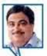
देशातील जलप्रवासा हा रस्तेप्रवासापेक्षा अधिक सुरक्षित असून, जलमार्ग विकासाला सरकार प्राधान्य देते आहे.