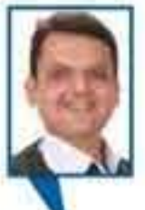
या आधी तरुणांना रोजगार शोधण्यासाठी वषणवण भटकावे लागत होते. या सरकारने त्यांच्यातील कौशल्यविकासाला बळ दिले, पण त्याचबरोबर त्यांना रोजगारही दिला.