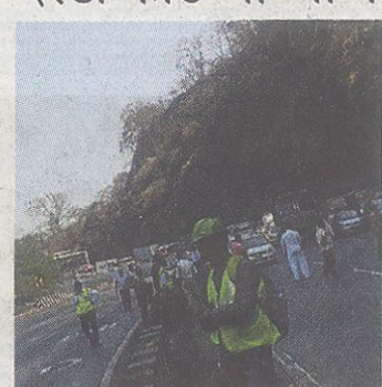
खोपोली : थांबविलेली वाहतूक

द्रुतगती महामार्गावरील आडोशी ते खोपोली घाटातील रस्त्यावर (लूज) कातळ व धोकादायक दरडी कोढण्याच्या कामाला आजपासून सुरुवात झाली; मात्र या कामाच्या काळात तासाभरानंतर प्रत्येकी २० मिनिटे वाहतूक बंद ठेवण्यात आल्यामुळे प्रवाशांचे हाल झाले. बहुसंख्य प्रवाशांना कामाची माहिती नसल्यामुळे प्रवाशांना मनस्ताप सहन करावा