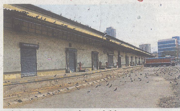
वाशी : माथाडी कामगारांच्या संपामुळे बाजार समितीतील शुकशुकाट.

या लाक्षणिक संपामध्ये नवी मुंबईसह महाराष्ट्रातील इतर जिल्ह्यातील बाजार समित्यांच्या आवारातील रेलवे माल धक्का, ट्रान्स्पोर्ट, किराणा, कापड, कापूस, मेटल व पेपर, लोखंड व पोलाद, जनरल विभागातील कामगार, सुरक्षा रक्षक, गोदी कामगार आदी ठिकाणच्या कामगारांनी सहभाग घेतला. दरम्यान, माथाडी प्रतिनिधींना समितीत स्थान न दिल्यास विधानभवनावर धडक मोर्चा नेण्याचा इशारा कामगार संघटनांनी दिला आहे.